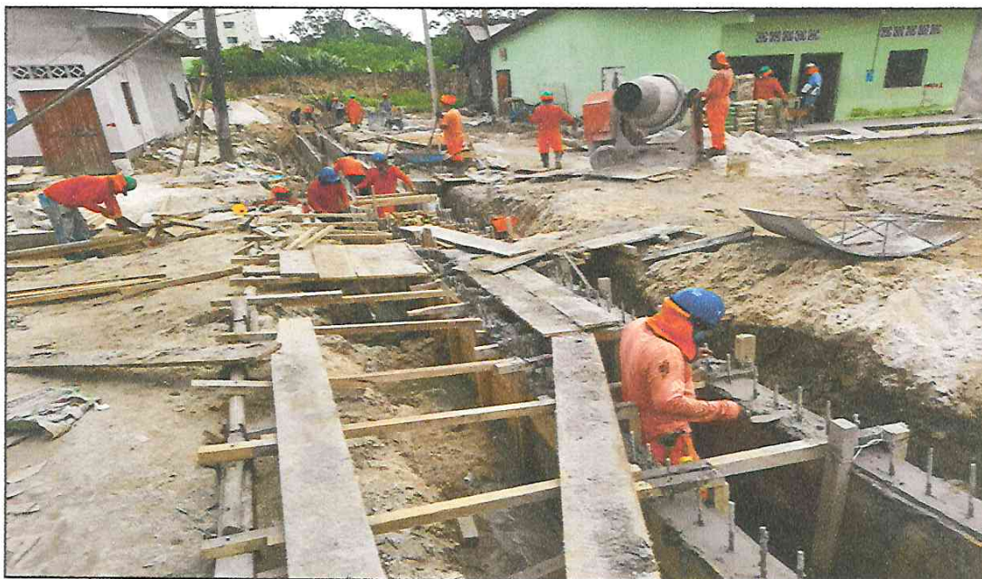
VISTA FOTOGRÁFICA N° 16: ENCOFRADO Y DESENCOFRADO EN MUROS LATERALES EN CANAL RECTANGULAR DE ALCANTARILLADO EN CALLE AMÉRICA TRAMO II.