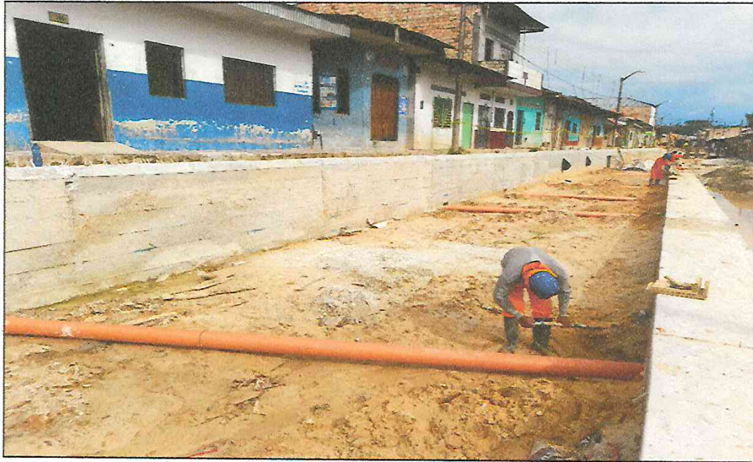
VISTA FOTOGRÁFICA N° 12: