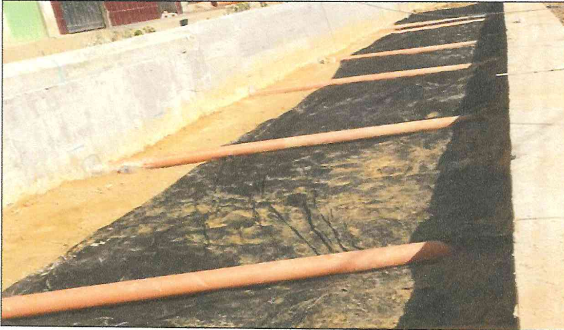
VISTA FOTOGRÁFICA N° 08: VACEADO DE LOSA DE RODADURA EN CALLE LAGUNAS TRAMO III.