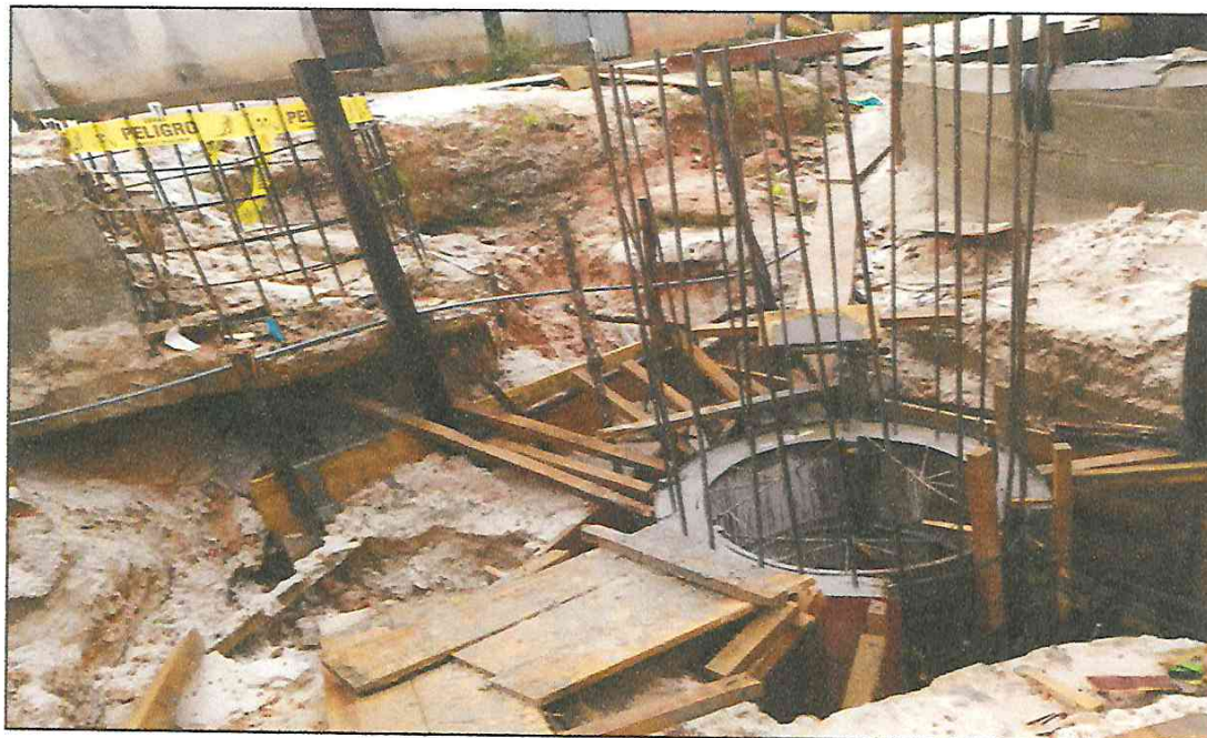
VISTA FOTOGRÁFICA N° 14: BUZÓN DE MORTERO ARMADO EN CALLE AMÉRICA TRAMO III.