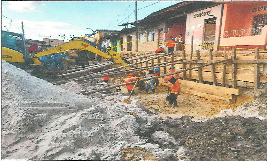
VISTA FOTOGRÁFICA N° 06: